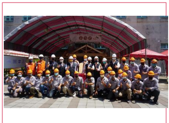
文化部部長、次長巡視人才培訓過程